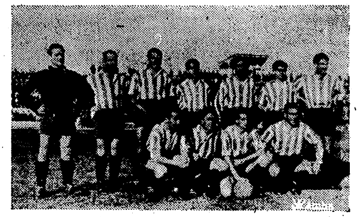
El Granada trajo un equipo tan jugador como siempre, completo de líneas, pero inocente a más no poder...