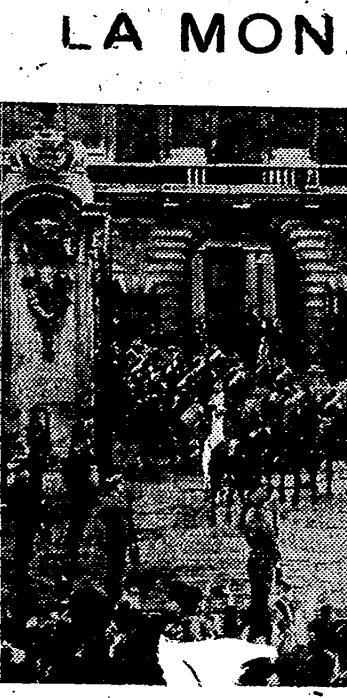
Inglaterra, modo de estabilidad política por temperamento y convicción de su pueblo, debe esta virtud no muy extendida precisamente al espíritu monárquico que hace de esta institución un puntal, el más firme, de la existencia de ese colorado imperio, que llega hasta los más apartados rincones del mundo. Cuando ha terminado la guerra el pueblo inglés no ha olvidado a la monarquía en la alegría de las fechas victoriosas y con ocasión del primer acto público en que los monarcas participaron oficialmente en la solemnidad, los londinenses rindieron un homenaje de simpatía y afecto a sus Reyes, del que esta fotografía recoge el instante inicial al salir la comitiva real del Palacio de Buckingham.