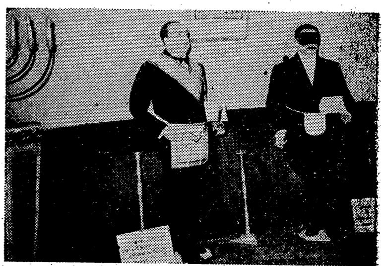
En París ha sido inaugurada recientemente una interesante exposición con objetos recogidos en las logias masónicas. He ahí dos «hermanos», con sus delantales y otros ridículos aditamentos

Washington, 4. — Aunque los dos candidatos presidenciales de los Estados Unidos han estado muy atareados durante el día de hoy, la campaña electoral puede darse por terminada. Ambos bandos predicen para sus candidatos una fácil victoria, pero en general se estima en Washington que Roosevelt será reelegido. Probablemente será un escrutinio record, porque nunca como ahora tomaron tan en serio los norteamericanos la campaña electoral. Desde todos los puntos del país llegan noticias del carácter apasionado que han tenido las reuniones políticas. El escrutinio de mañana constituirá un acontecimiento de gran alcance mundial. — Efe.