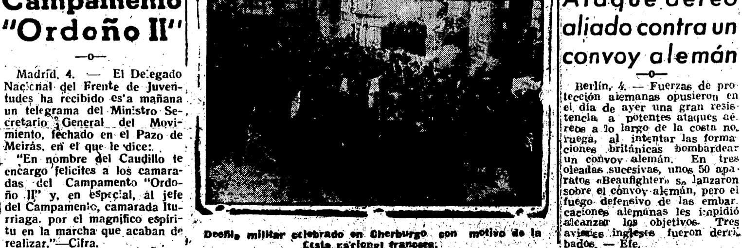
Desfile militar celebrado en Cherburgo con motivo de la toma de esta ciudad por los aliados.