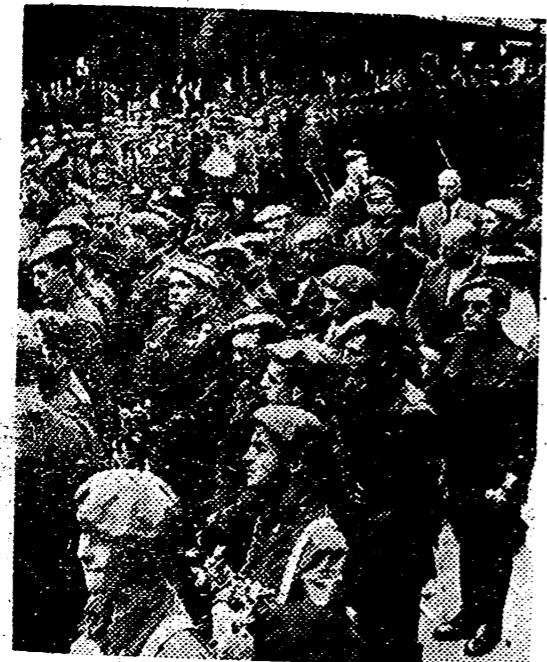
A su llegada a una estación alemana, los miembros de la División Azul son recibidos con honores militares rendidos por las fuerzas del Reich.