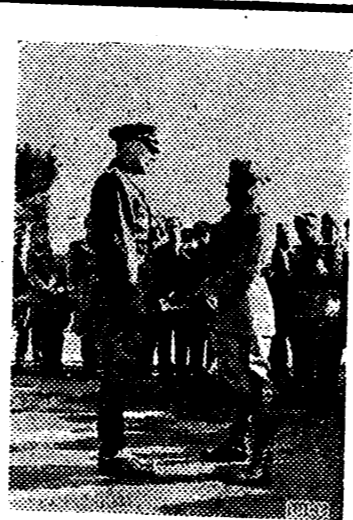
En un campo de maniobras del Ejército italiano, el Duce conversa con el General von Rintelen, jefe de la misión militar germana actualmente en Italia.

Madrid, 4. — Continúan sin novedad los voluntarios de la "División Azul". En el campamento donde se hallan todo es alegría y espíritu falangista. Cada mañana se alzan al cielo las manos de los voluntarios que encuentran como fondo natural el «Cara al Sol» que aquí en tierras que no son españolas suena de otra manera, más vibrante, más emocionada quizá. — Cifra.