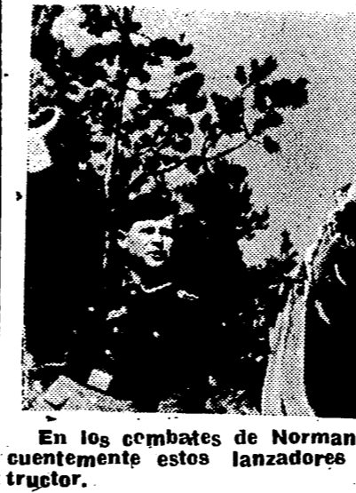
En los combates de Normandia los alemanes emplean frecuentemente estos lanzadores de extraordinario poder destructor.