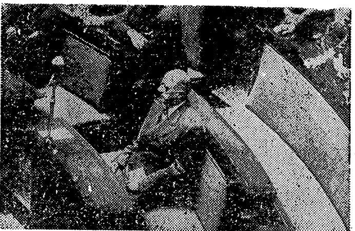
Sentado s/o en el banco del Gobierno, el General De Gaulle espera el momento de leer su declaración, tras la cual la Asamblea votó su investidura por 329 a favor y 224 en contra.

PARIS, 4. — El General De Gaulle ha salido en avión del aeropuerto de Orly, a las 9:07 de esta mañana (hora española), con destino a Argel. — Etc.