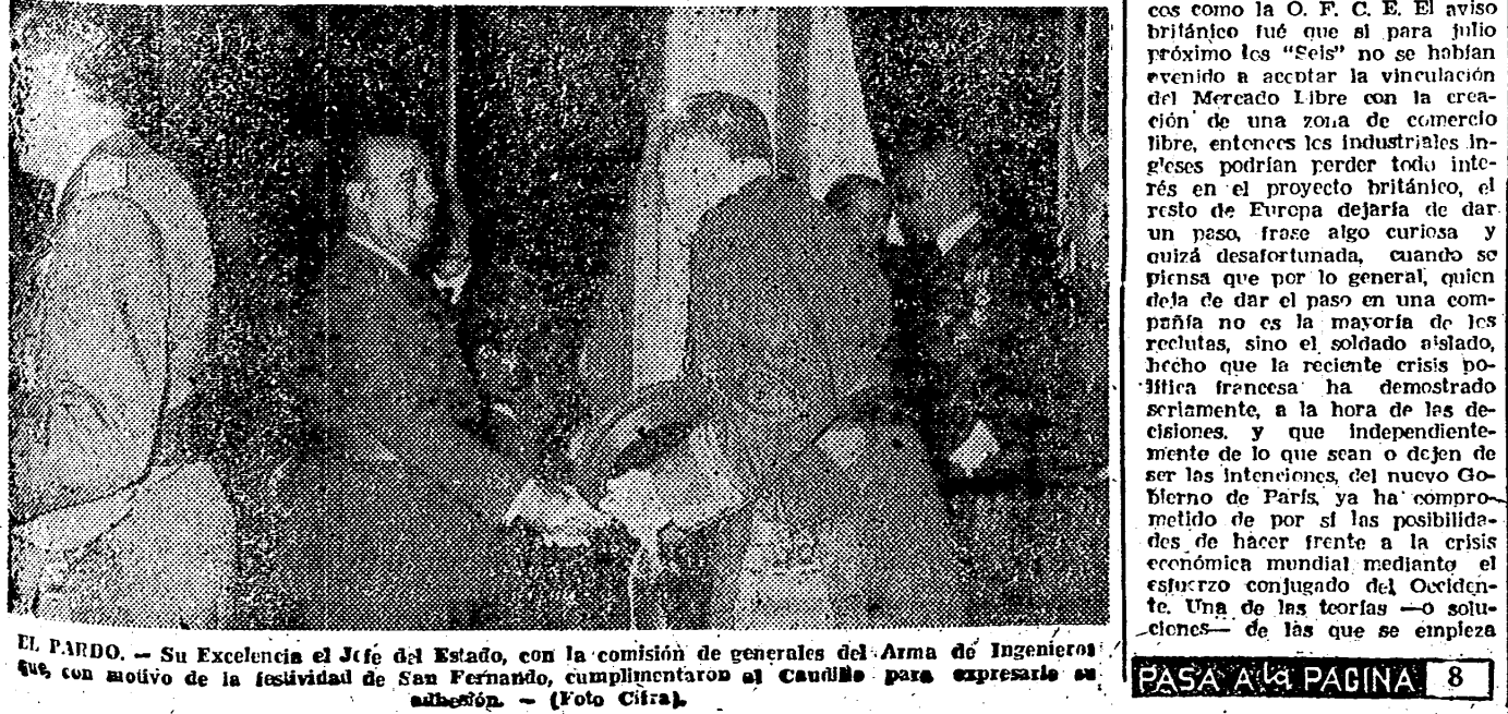
EL PARDU. — Su Excelencia el Jefe del Estado, con la comisión de generales del Arma de Ingenieros que, con motivo de la festividad de San Fernando, cumplimentaron al Caudillo para expresarle su adhesión.