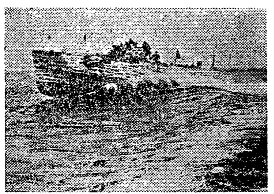
La perfección de los puentes en desfigurar las embarcaciones para huir de las lanchas rápidas alemanas, cuya silueta se confunde a distancia con los reflejos del mar, haciéndolas pasar desapercibidas para el adversario.

Las pérdidas soviéticas en hombres y mate-