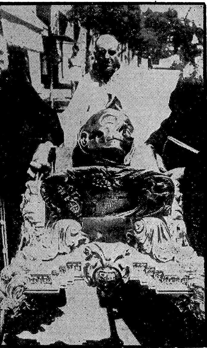
BARCELONA. — De paso para Munich, llegó a Barcelona, el cráneo de San Pascual Ballón, Patrono de los Congresos Eucarísticos Internacionales. Aquí vemos la preclara y venerada reliquia.

En la explanada donde se celebrarán los actos plenarios caben perfectamente un millón de personas