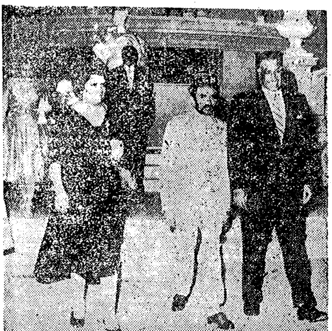
EL CAIRO. — La esposa del Presidente Nasser, ha hecho su primera aparición en la prensa cairena, pero sin ser identificada. Durante siete años el Presidente de la EAU, mantuvo la más ortodoxa tradición egipcia, de que las mujeres no aparecen en público. En la foto, a la izquierda la señora Nasser y su esposo, acompañados al Emperador de Etiopía, con motivo de la cena que le fué ofrecida en su reciente visita a El Cairo.