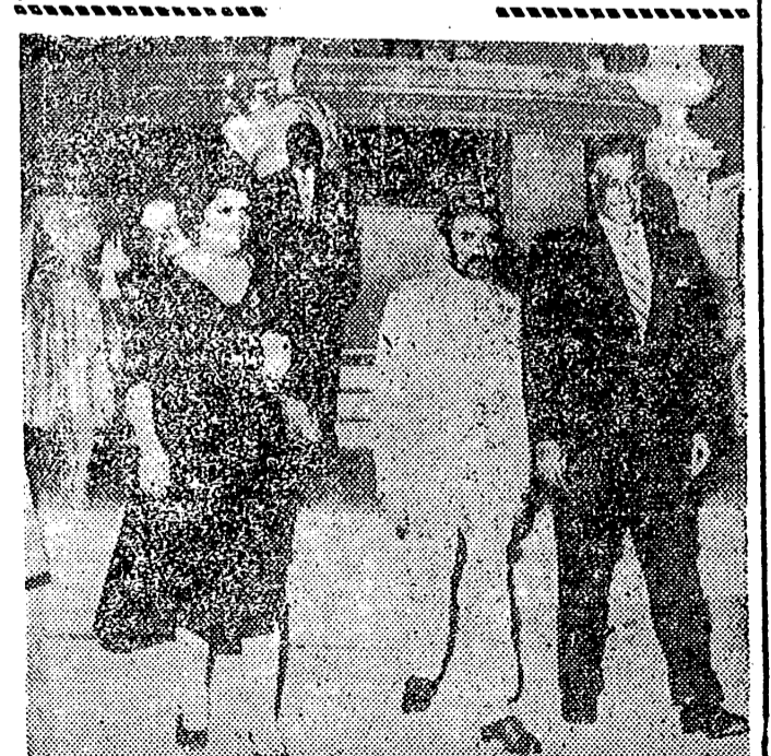
EL CAIRO. — La esposa del Presidente Nasser, ha hecho su primera aparición en la prensa caireña, pero sin ser identificada. Durante sus años de Presidente de la RAU, muy nuevo la más ortodoxa tradición musulmana, de que las mujeres no aparecen en público. En la foto, a la izquierda la señora Nasser y su esposo, acompañados al Emperador de Etiopía, con motivo de la cena que le fué ofrecida en su reciente visita a El Cairo.