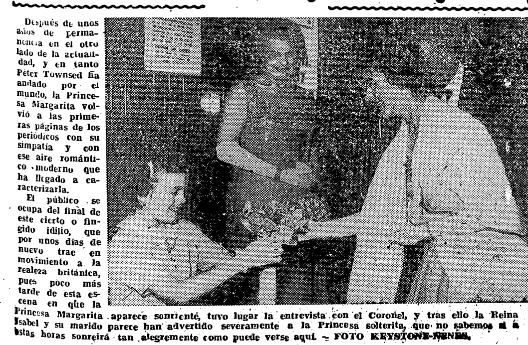
Después de unos años de permanencia en el extranjero, la Princesa Margarita volvió a las primeras páginas de los periódicos con su simpática y con ese aire romántico-moderno que ha llegado a caracterizarla. El público se ocupa del final de este cierto o fingido idilio, que por unos días de nuevo trae en movimiento a la realeza británica, pues poco más tarde de esta cena en que la Princesa Margarita apareció sonriente, tuvo lugar la entrevista con el Coronel, y tras ello la Reina Isabel y su marido parece han advertido severamente a la Princesa solterita, que no sabemos a estas horas sonreirá tan alegremente como puede verse aquí.