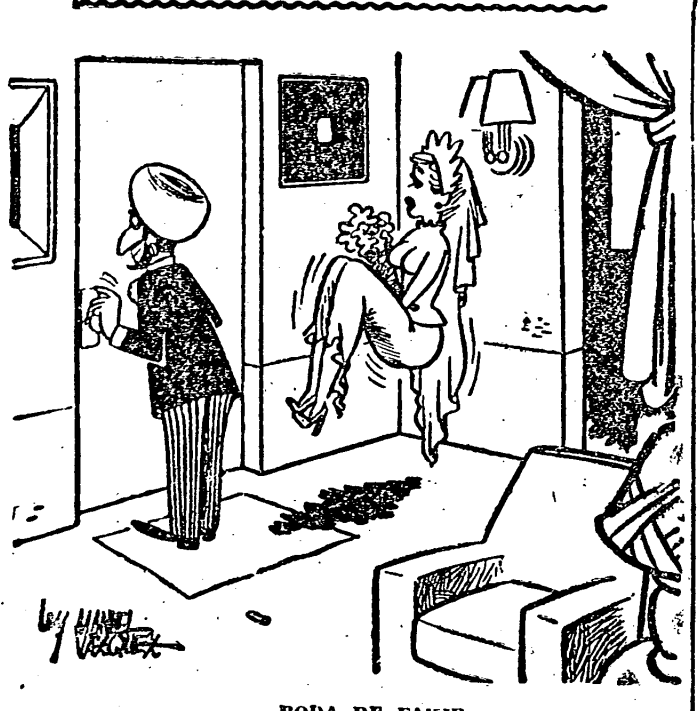
RODA DE FAKIR.