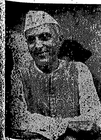
Dr. Nehru antiguo Pr. sident del Congreso Nacional indio, uno de los más destacados líderes contra el imperio indio, recientemente detenido por las fuerzas británicas

Números: 2.615, Oviedo, Huelva, Barcelona, Sevilla; 4.284, Igualada, Cádiz, Barcelona, Madrid; 5.182, Madrid, Huelva, Jerez de la Frontera, Vigo, Logroño; 5.282, San Felix de Llobregat, Sevilla, Abcete, Cartagena, Pola de Siera; Madrid; 7.286, Oviedo, Huelva, Alcante, Sevilla, Valencia, Madrid; 7.528, Málaga, Barcelona, Ciudad Real, Valladolid; 8.696, Málaga, San Sebastián, El Ferrol del Caudillo, Ceuta, Jaén, Cifra.