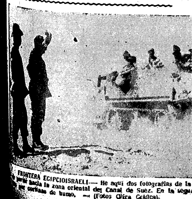
FRONTERA EGIPCIOSRAELI. — He aquí dos fotografías de la guerra entre Egipto e Israel. En la primera, fuerzas motorizadas israelíes en el momento de cruzar la zona oriental del Canal de Suez. En la segunda, toma de un tanque israelí, apoyado por los carros de combate, en un ataque nocturno.

El resultado de la votación fué de 64 votos contra 5 Hasta el cumplimiento de la moción, continuará abierta una sesión de urgencia en la Asamblea General