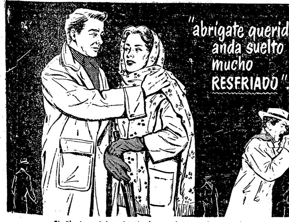
Si. El virus del resfriado le acecha a Vd. en todas partes...