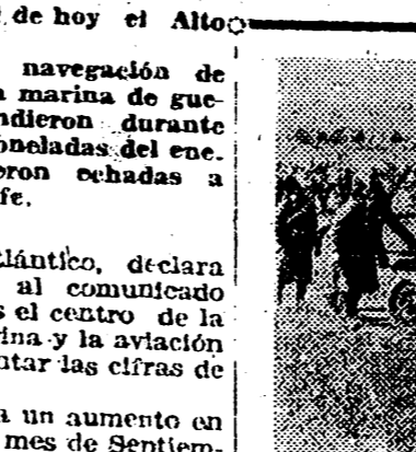
Artilleros del Cuerpo Expedicionario italiano en Rusia, trasladan sus piezas a líneas más avanzadas del frente, a medida que los tanques y la infantería, conquistan nuevas posiciones.

Los éxitos de los submarinos demuestran claramente que en el porvenir habrá que contar también con la eficacia de su acción.