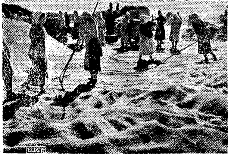
En la zona soviética conquistada gracias a los victoriosos avances ininterrumpidos de las fuerzas del Eje, se han hecho normalmente las operaciones pese a la orden de incendiar sus cosechas dada por Stalin. La fotografía muestra a numerosas mujeres ucranianas, amontonando el grano una vez terminada la trilla.