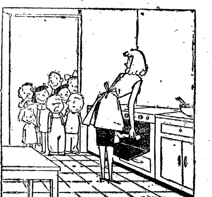
—O SU HIJO ES UN MENTIROSO, O USTED HACE LOS PASTES MAS RICOS DEL BARRIO. ¡VENIMOS A COMPROBARLO!