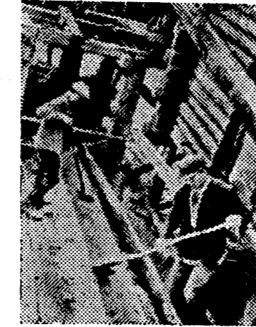
Obreros rusos proceden al lavado de las enormes cantidades de oro de los yacimientos soviéticos, según la propaganda del país

sótanos del Banco de España la impronta de sus garras. El oro español huyó del país empujado por los distintos gobiernos marxistas. Esta afirma-