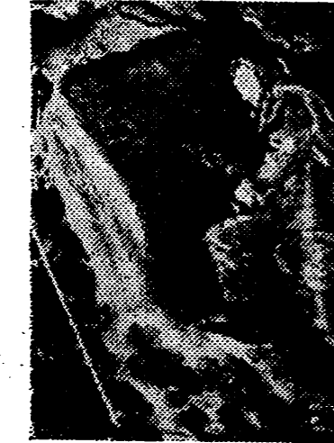
Minero «stajanovista», cuyos méritos canta la propaganda soviética

los que nos ofrece una de aquellas revistas “U. d. S. S. R. en construcción”, bien presentadas tipográficamente como es un alarde técnico ofrecido al posible lector para seducirlo con la persuasión de la propaganda escrita.