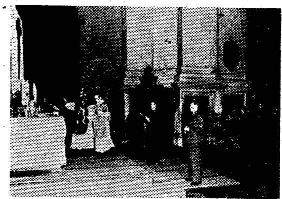
Un sacerdote alemán celebra, en las proximidades del frente, una misa de campaña, a la que asisten los soldados católicos franceses de servicio

Se añade que en Alemania no puede producir más que optimismo la idea de que el General Wawell vaya ahora a poner sus manos en el mando militar de la India. — Efe.