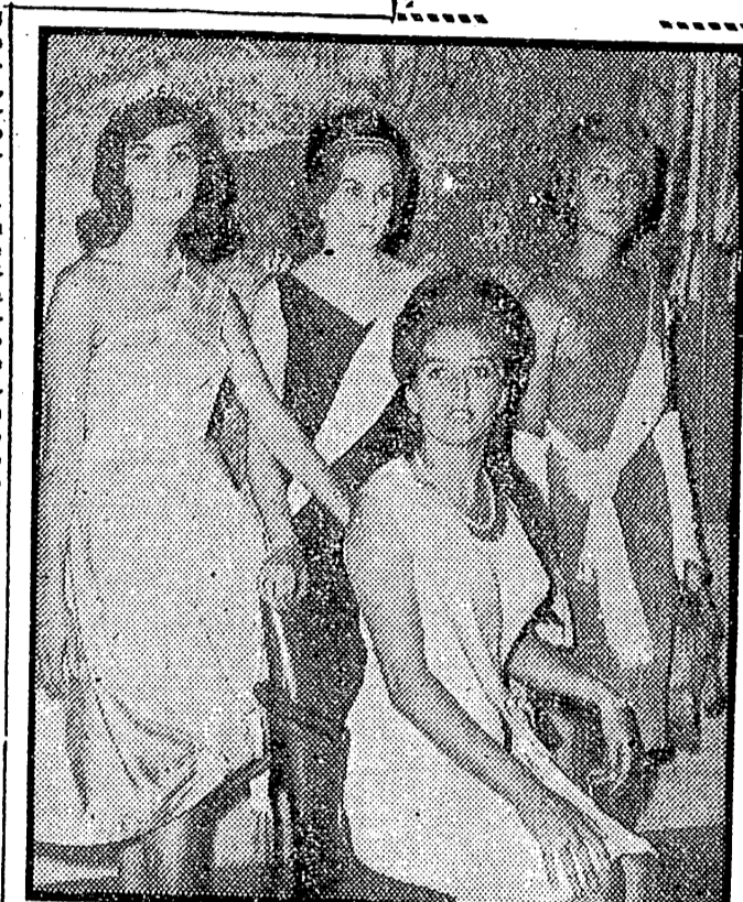
He aquí las cuatro triunfadoras del concurso nacional para elegir "Estrella España 1960". A la izquierda, la "Estrella de Valencia" y junto a ella las ganadoras de Madrid y Cataluña. En el centro y delante, la representante de San Sebastián, que ha conquistado el título de "Estrella España 1960", y representará a nuestro país en el concurso europeo de belleza que, dentro de unos días, se celebrará en Beirut.