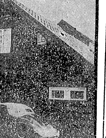
LONDRES. — Casa de campo de estilo noruego en Eitree, 12, en la que se han sido robadas a la popular actriz cinematográfica Sofia Loren joyas por valor de 180.000 libras. Sofia trabaja actualmente en la película "The Millionaires", versión cinematográfica de la obra de Shaw.

ANKARA, 2. — Circula el rumor de que han sido detenidos ciento cincuenta oficiales del Ejército por el régimen revolucionario del General Canel. El diario republicano "Ulus", publica un decreto en el que se hace un llamamiento a la población para que entregue las armas de fuego en el plazo de cinco días a contar de mañana. Se informa que el hijo del ex presidente Bayar, Turgun, embajador en Bélgica, ha declarado que aprueba el golpe del Ejército, pero no hizo comentarios al preguntársele si pensaba regresar a Turquía. El Ministro de Asuntos Exteriores, Selim Sarper, ha dicho que no se piensa introducir cambios en los servicios diplomáticos. — Efe.