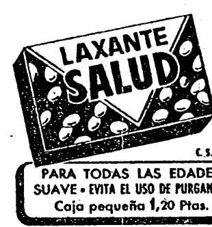
PARA TODAS LAS EDADES SUAVE - EVITA EL USO DE PURGANTES Caja pequeña 1,20 Ptas.

Según ha anunciado el cirujano que hizo la operación, las dos hermanas se hallan bien. — Efe.