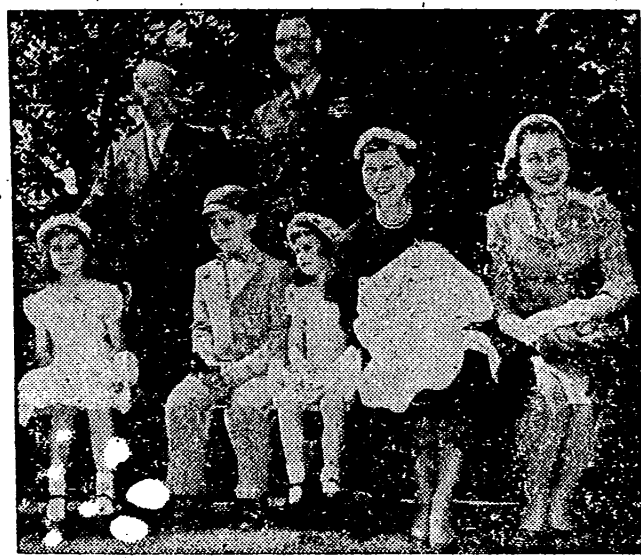
El Presidente Eisenhower y su esposa sonríen al posar para esta fotografía hecha con sus nietos, entre los que por primera vez aparece el benjamín...