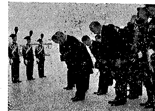
En su reciente viaje a Europa, el Ministro japonés de Relaciones Exteriores, Yosuka Matsuo, rinde homenaje a la tumba del Soldado Desconocido en Roma.

Washington, 2. — Halifax ha conferenciado con Welles, sobre la cuestión del Irak. — Efe.