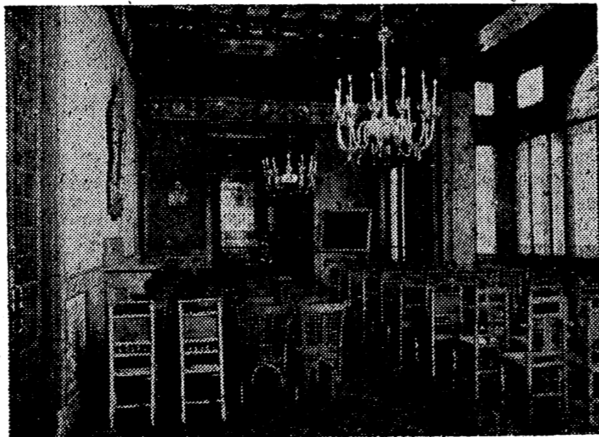
Una de las aulas del Instituto Italiano de Cultura inaugurado recientemente en Madrid en presencia de S. E. Luis Federzoni, Presidente de la Real Academia de Italia