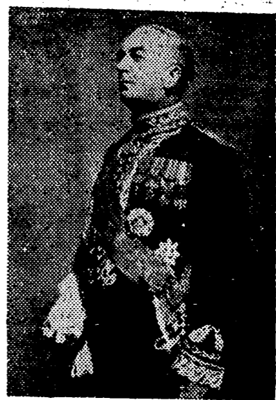
S. E. Luis Federzoni, Presidente de la Real Academia de Italia, huésped ilustre de España en la actualidad, a quien el Caudillo concedió la Gran Cruz de la Orden Imperial del Yugo y las Flechas.

S. E. U.: Autorización para celebrar un partido de hockey femenino contra una selección universitaria alemana y un partido de fútbol contra una selección universitaria italiana el día 28 de marzo en Madrid. Se reserva la correspondiente conformidad de los delegados respectivos. — Cifra.