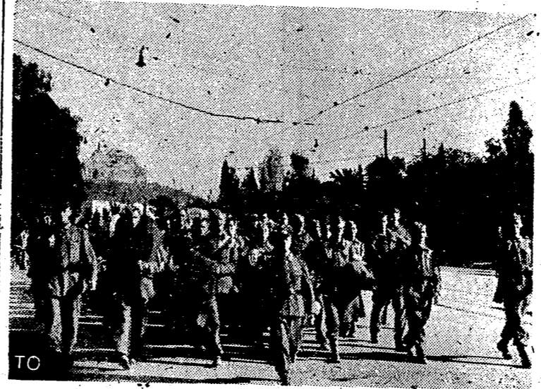
Un grupo de soldados británicos hechos prisioneros en una de las islas del Dodecaneso, llegan a Atenas recientemente para ingresar en un campo de concentración.