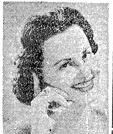
Gianna D'Angelo, cuya juventud, belleza y dominio del "bel canto" la sitúan entre los primeros puestos de la lírica mundial.