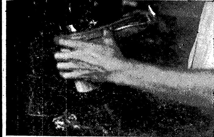
Un par tras otro, la máquina no cesa en su tarea de coser el cerco

Queda aún un aspecto—quizás el más interesante—, y es la atención de los empresarios