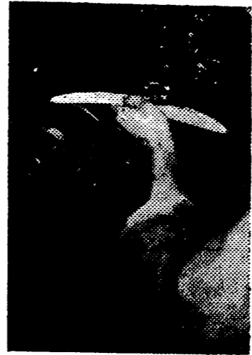
Preparación de la polmilla en la fabricación de calzado

el cerco, amartillado luego, y extraídas las puntas que fueron clavadas en la horma para sujetar todo este artilingo, porque luego viene aquello de la planta en cuyo centro queda el cambrillón de madera y un trozo de corcho impermeable, y la unión de la suela, y el recorte del sobrante. Abierto ya el hendido, se hace a continuación el cosido con un hilo impregnado de pez, que le da igual consistencia como si estuviera hecho a mano. Todavía queda el cerrar el hendido pegándolo y el marcar el punto sobre el cerco y el pasar el rodillo que alisa y deja perfecta la suela.