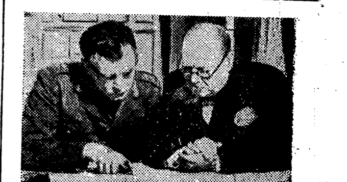
Mr. Churchill con el jefe supremo de la aviación canadiense en Inglaterra, escucha las explicaciones de éste sobre la distribución de las fuerzas aéreas de su mando.

Todos los aviones alemanes que han participado en estos ataques regresaron a sus bases. — Efe.