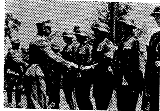
Cazadores alpinos del Ejército alemán son condecorados por el general de su división, momentos antes de emprender la marcha sobre las tierras rusas que van a redimirse del comunismo

Segovia, 1. — Con gran entusiasmo continúa la inscripción de voluntarios para luchar contra Rusia. — Cifra.