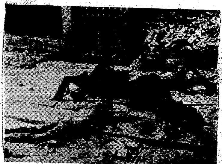
La guerra ha llevado el terror a las ciudades de la retaguardia y sobre el pavimento de las calles, después de un bombardeo, aparecen estos cadáveres estraños por el terror y el fuego, vergüenza de un mundo civilizado.