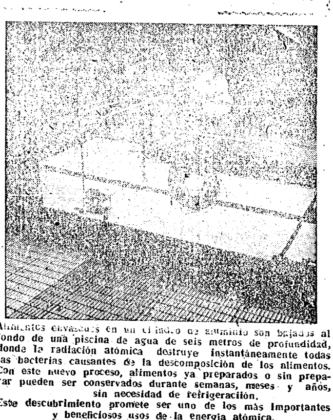
Alimentos envasados en un cilindro de aluminio son bajados al fondo de una piscina de agua de seis metros de profundidad, donde la radiación atómica destruye instantáneamente todas las bacterias causantes de la descomposición de los alimentos. Con este nuevo proceso, alimentos ya preparados o sin preparar pueden ser conservados durante semanas, meses y años, sin necesidad de refrigeración. Este descubrimiento promete ser uno de los más importantes y beneficiosos usos de la energía atómica.