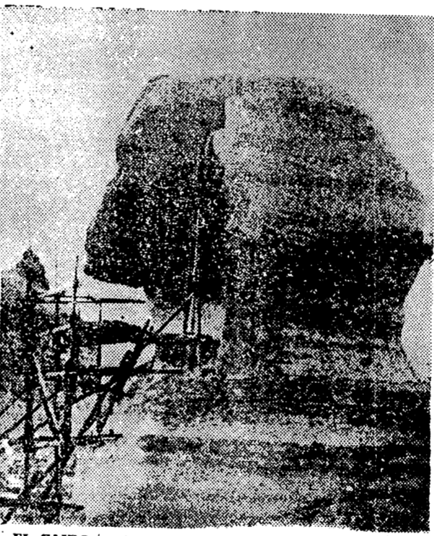
EL CAIRO. — El tiempo no pasa en balde ni para la Estirpe de Giza. Por eso ahora se levanta junto a ella un monumental andamiaje para su limpieza y reparar su nariz de los destrozos causados por los soldados de Napoleón, en 1798.