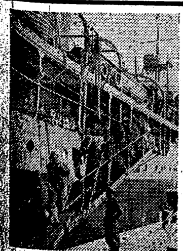
Desembarco de tropas italianas en Albania

Dicho barrio ocupará un kilómetro cuadrado y en él se celebrará la Exposición Permanente de Productos de España. — Cifra.