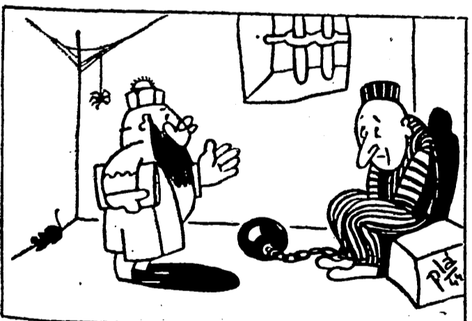
—Y por qué mató a su padre? —Verá, en algo había uno de extraterrestres.