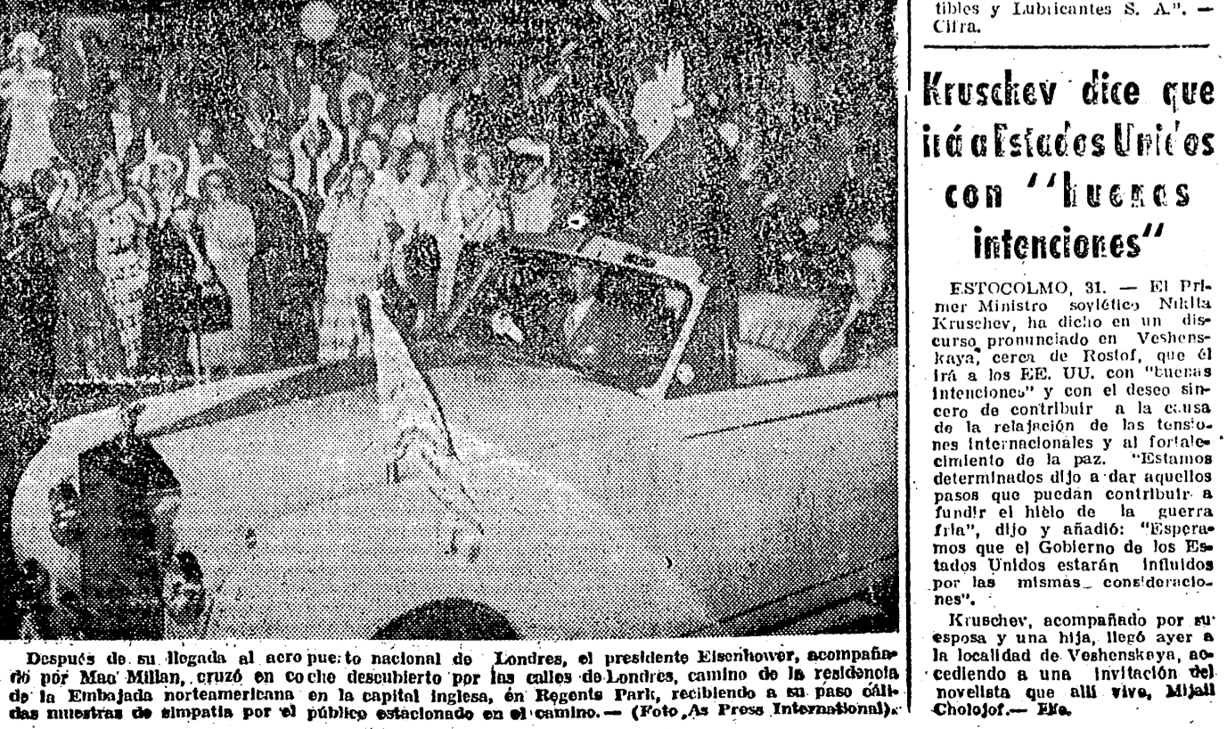
Después de su llegada al aeropuerto nacional de Londres, el presidente Eisenhower, acompañado por Mac Millán, cruzó en coche desahogado por las calles de Londres, camino de la residencia de la Embajada norteamericana en la capital inglesa, en Regents Park, recibiendo a su paso cálidas muestras de simpatía por el público estacionado en el camino.