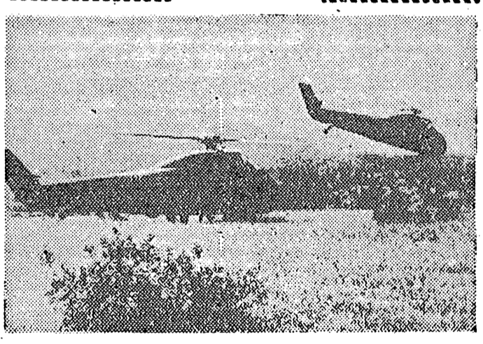
Continúa la operación "Jumelle", en la zona de Kabylie, en Argelia. En la foto, aparecen varios soldados franceses saltando de un helicóptero de transporte que les ha llevado a estos parajes. Otro, se dispone a tomar tierra. Antes, los cazas, han ametrallado el terreno como cortina protectora para los soldados.