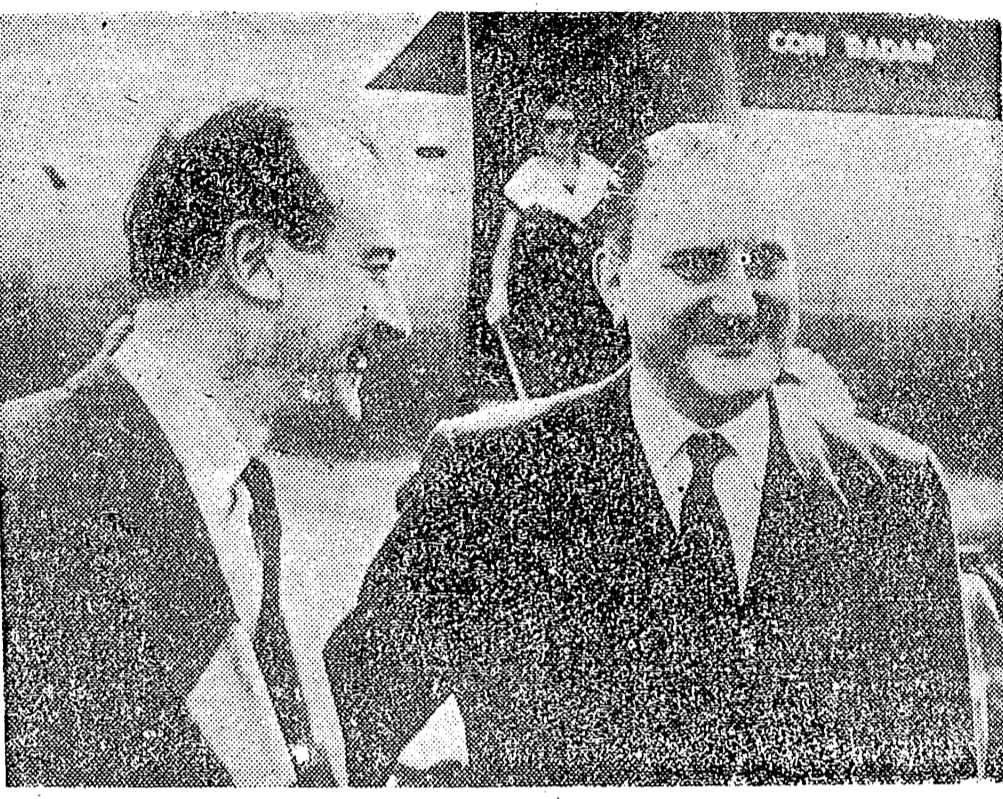
LONDRES.— El ministro español de Asuntos Exteriores, señor Castiella, a su llegada a Londres, para entrevistarse con el presidente Eisenhower.

El Ministro español le hizo entrega de un mensaje del Caudillo, al que el Presidente contestó inmediatamente