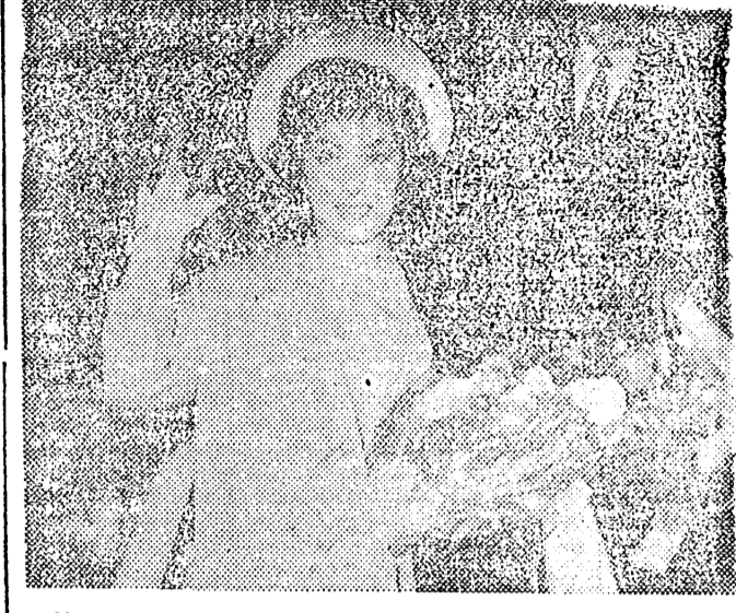
VENECIA. — — Gina Lollobrigida ha abandonado Venecia después de asistir a la inauguración del Festival de Cine...