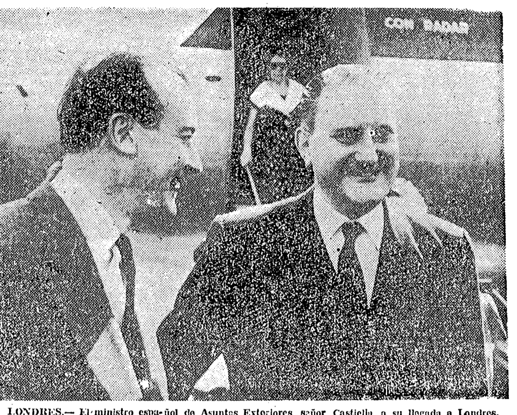
LONDRES. — El ministro español de Asuntos Exteriores, señor Castiella, a su llegada a Londres, para entrevistarse con el presidente Eisenhower.