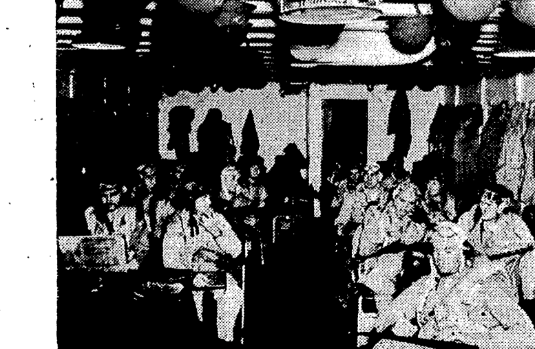
Aviadores de la Marina norteamericana reciben las instrucciones finales a bordo del portaviones...