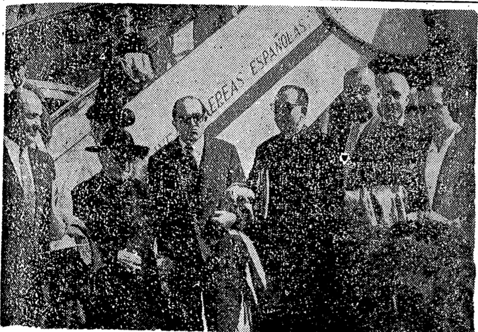
MADRID. — El cardenal primado, doctor Pla y Deniel, con los ministros Secretario General del Movimiento, de Educación Nacional y subsecretario de la Presidencia, señores Solís, Rubio y Carrero Blanco, fotografiados a su llegada a Barajas, de regreso de Bruselas, donde asistieron al "Día de España", en la Exposición Internacional.