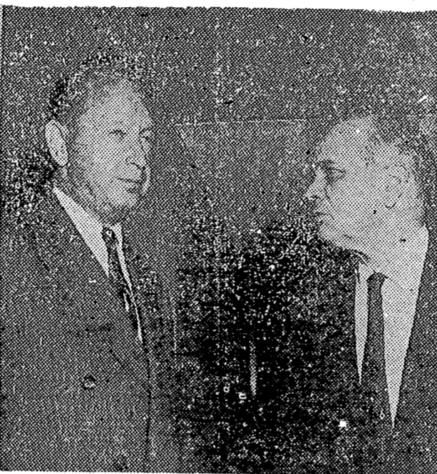
En Nueva York, el secretario de los Naciones Unidas, Dag Hammarskjöld, en una de las sesiones de las reuniones del Consejo de Seguridad.