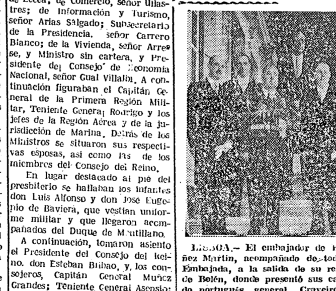
LISBOA. — El embajador de España en Portugal, don José Martín, acompañado de todo el personal diplomático, al salir de la Embajada, a la salida de su residencia para dirigirse al Palacio de Bolon, donde presentó sus cartas credenciales al Jefe del Estado portugués, general Craveiro Lopes.