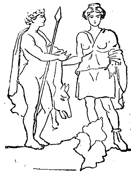
Atalante y Meleagro

Meleagro, héroe de esta empresa, se enamoró de la belleza de Atalante y la entregó la cabeza y la piel del animal, de cuyos trofeos victoriosos la desposeyeron los hijos de Testios, celosos é indignados de ver que se atribuía la victoria a una mujer; pero esta osadía de los envidiosos fué castigada con la muerte por Meleagro.