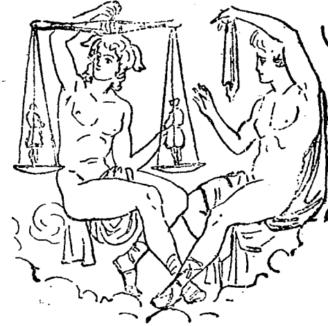
La balanza del Destino

Todo en el universo está sometido al imperio de estas tres hermanas. A ellas son debidos los movimientos de las celestes esferas y la armonía de los principios constitutivos del mundo; por ellas ha sido prevista la suerte de cada ser y de cada cosa. Las Parcas profetizan, cantan y volan de un modo especial por el