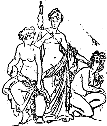
Las Tres Parcas

Refiere la fábula mitológica que, en vez de ser representado por medio de una sola divinidad el oculto poder que, como señor absoluto, dispone de la existencia humana y