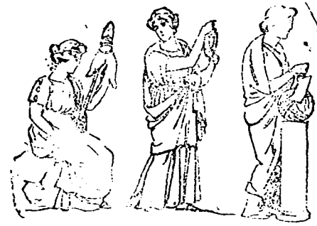
Las Parcas, según el arte griego.

veces, dorada diadema que sujeta sus cabellos.