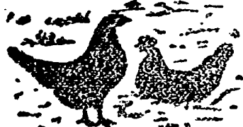
MACA DE FÁBRICA REGISTRADA

¡¡¡3000, TRES MIL!!! HUEVOS AL AÑO CON DIEZ GALLINAS