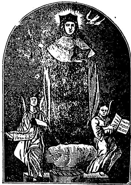
Cliché de gran mérito, grabado en madera por un artista anónimo.

Celebra nuestra Santa Madre la Iglesia Católica, la fiesta de Santa Teresa de Jesús; la mística doctora, la ilustre fundadora del Carmelo, la Santa simpatía, la inmortal castellana, el prototipo de la mujer clásicamente católica y española. En todo el mundo brillará con igual resplandor la imagen de esta insigne compatriota entre montañas de flores y torrentes de luz, y millares de voces cantarán sus virtudes extraordinarias. Virtudes, que, aun esculpidas al modelo delineado con la pluma del divino Maestro, sin embargo, llevan un sello especial, característicamente sugestivo, que atrae irresistiblemente a cuantos se paran a considerar la heroica de la Virgen de Avila.