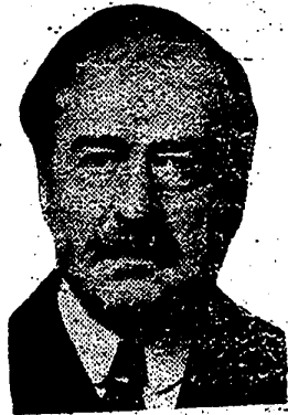
Don Vicente Blasco Ibañez

Adaptación de la famosa novela del mismo título del inmortal no- velista valenciano.