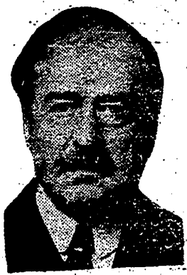
Don Vicente Blasco Ibáñez

Adaptación de la famosa novela del mismo título del inmortal novelista valenciano.