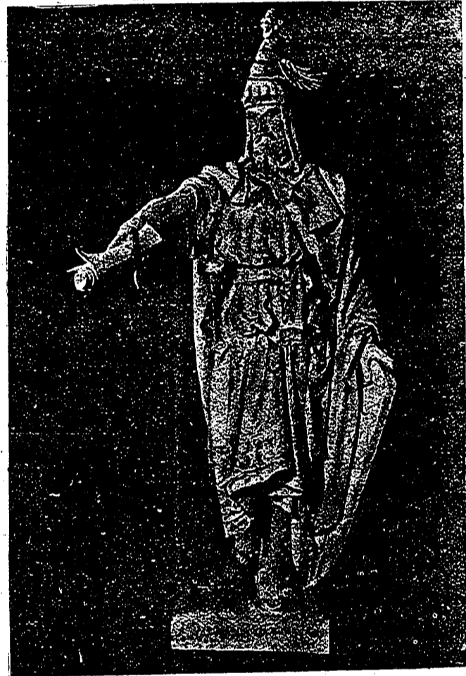
PROYECTO DE MONUMENTO AL REY DON JAIME EN LA PLAZA DE SU NOMBRE DE ESTA CIUDAD