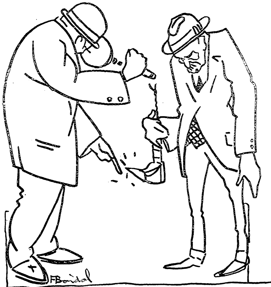
El de la lupa: Pues buscando una pareja del casco. El otro: —Y yo un municipal.

Durante el martes y miércoles de esta semana, se han efectuado con resultado feliz, excelentes medidas sanitarias para la extinción de microbios y especialmente el del paludismo: Ha hecho un viento huracanado.