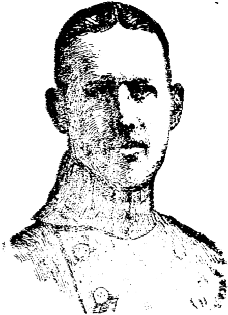
El príncipe Alejandro, en quien su padre ha abdicado la corona de Grecia.

Décimacuarta. Los gastos que ocasione la presente operación y los intereses correspondientes al segundo semestre del año actual se pagarán con cargo al Presupuesto extraordinario que se ha forma-