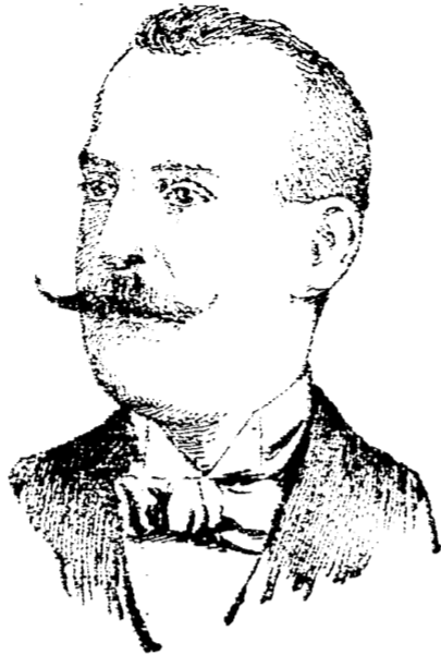
El ex-rey Constantino de Grecia

(De venta en todas las farmacias y droguerías bien surtidas)