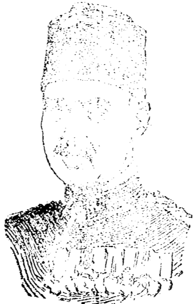
El general Lluís von Sueders jefe de la Comisión Instructiva de España del ejército ruso a quien ha ido a saludar el general Von der Goltz.

La reciente invasión de Bélgica, en sea a las naciones débiles que las poderosas no respetan el derecho aje-